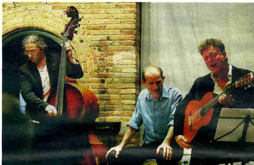
Il Gran Teatro Amaro. s.f

“La idea de trabajar de esta manera surgió como reacción a la evolución, digamos normal, de los grupos, cada vez con más amplificación, con equipos y escenarios más grandes, con lo que cada vez se levantaba una barrera más grande entre el público y el músico”, comentó Gat, miembro de un proyecto que cuesta definir. “Il Gran Teatro Amaro reco-